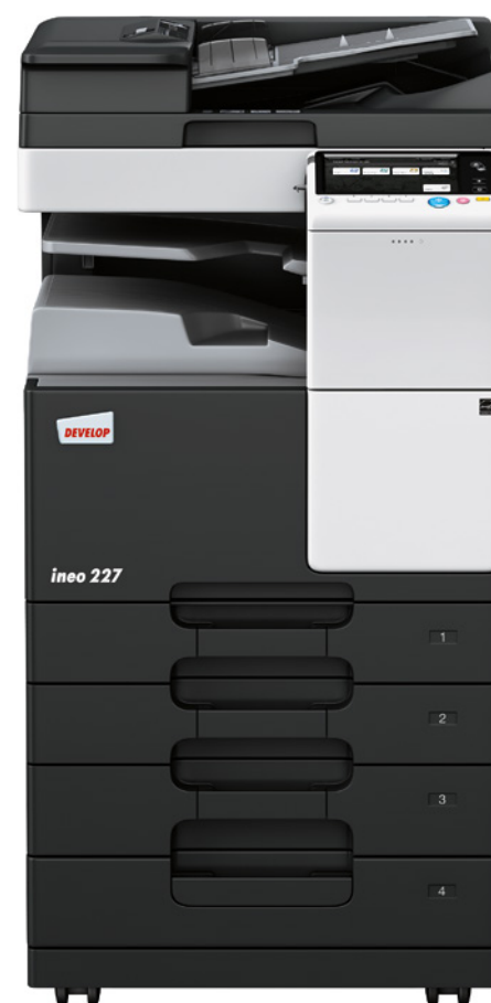
ineo 227 s oboustranným podavačem originálů (DF-628), oddělovací přihrádkou (IS-506) a dvěma přidavnými kazetami (PC-213)