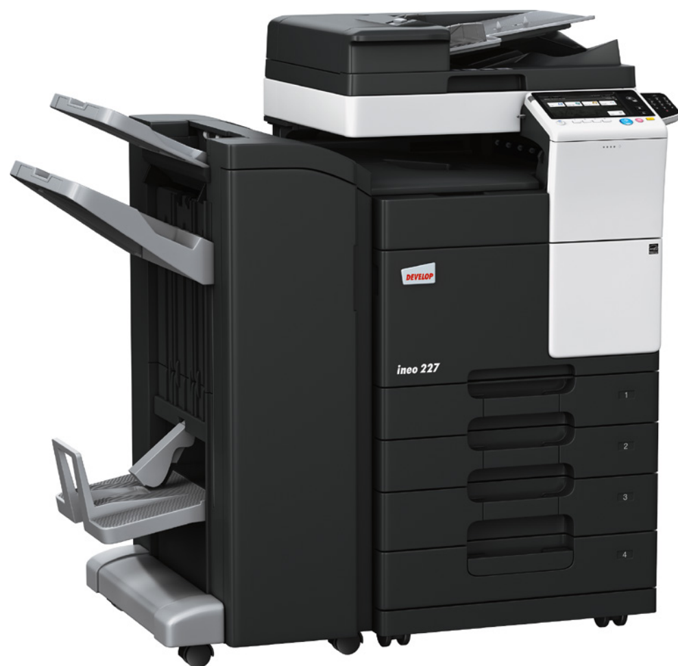
ineo 227 s podavačem originálů (DF-628), brožovací finišerem (FS-534SD), dvěma přídatnými kazetami (PC-213) a číselnicí (KP-101)

Úsporná elektronika a okamžité vypínání částí stroje, které nejsou právě používány, zajišťují ještě podstatně nižší spotřebu energie, než vyžadují ekologické standardy Energy Star a Blue Angel. Provoz stroje vás tak vyjde na méně než 1 Kč denně. Vaši kapsu i přírodu šetří také další funkce, jako například automatické odstranění prázdných stránek, zabráňující zbytečnému kopírování a plýtvání papírem. Používaný toner obsahuje biomasu a díky své nižší zapékací teplotě je velmi šetrný k životnímu prostředí.