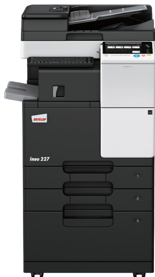
ineo 227 s oboustranným podavačem originálů (DF-628), vestavěným finišerem (FS-533), velkokapacitní kazetou (PC-413) a držákem klávesnice (KH-102)

Úřady, školy a univerzity, kanceláře architektů, pojišťovny, banky, knihovny: spousta malých nebo středních firem ve skutečnosti nepotřebuje tisknout barevně. Zaměstnanci těchto organizací často potřebují černobílé multifunkční zařízení, které se snadno používá a nabízí pestrou škálu mobilních funkcí.