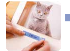
Nelaminované TZe pásky perfektní pro každodenní použití