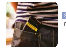
Standardní laminované TZe pásky perfektní pro každodenní použití

Volba vhodné pásky podle způsobu použití