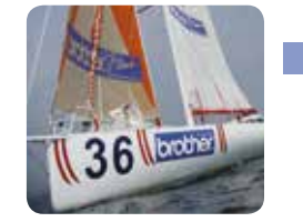
Extrémně adhezivní TZe pásky pro tvarované, drsné nebo nerovné povrchy