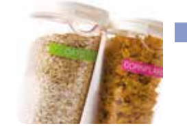
Flexibilní TZe pásky pro označení kolem ostrých hran a kulatých ploch