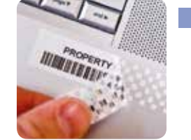
Plombovací TZe pásky bezpečnostní páska, ze které se po odlepení nevratně oddělí spodní vrstva ve formě viditelného rastru drobných čtverečků