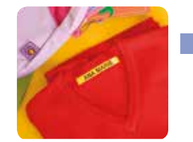
Zažehlovací TZe pásky speciální pásky pro značení textilií